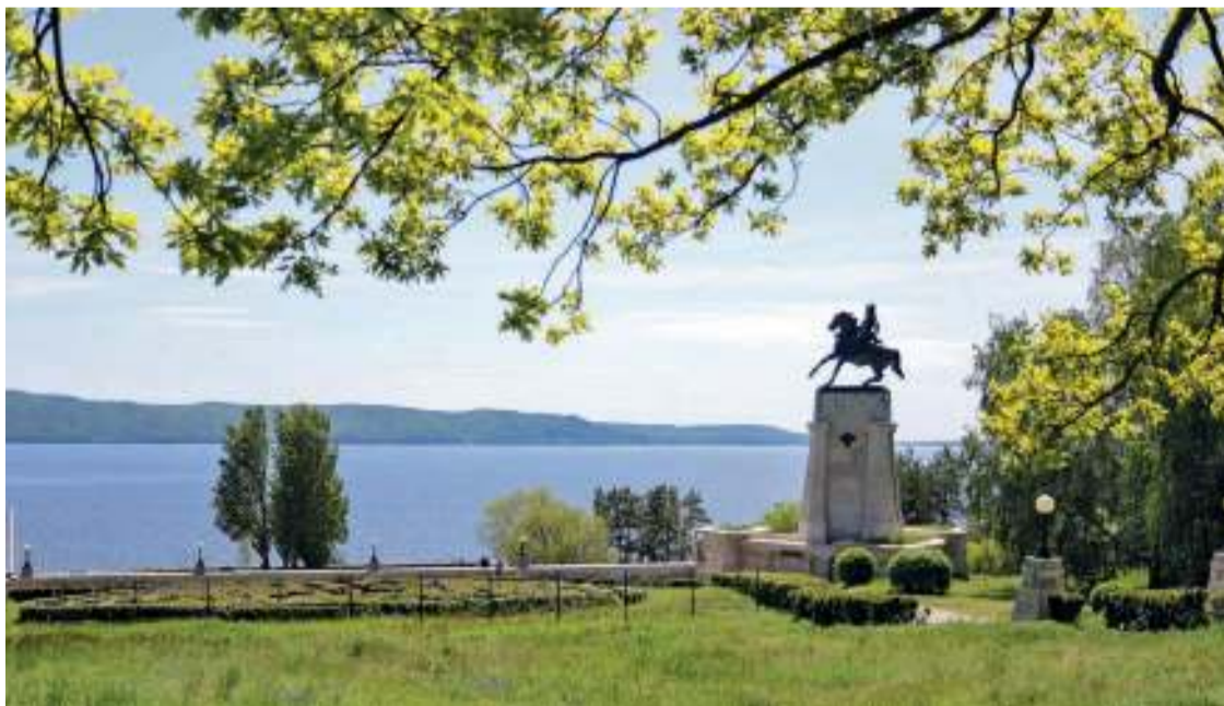
Министр туризма Самарской области: «Если говорить о городах области, которые стоит посетить с туристической целью, то мой любимый – Тольятти. Он уверенно движется в своём развитии от города-завода к городу-курорту»