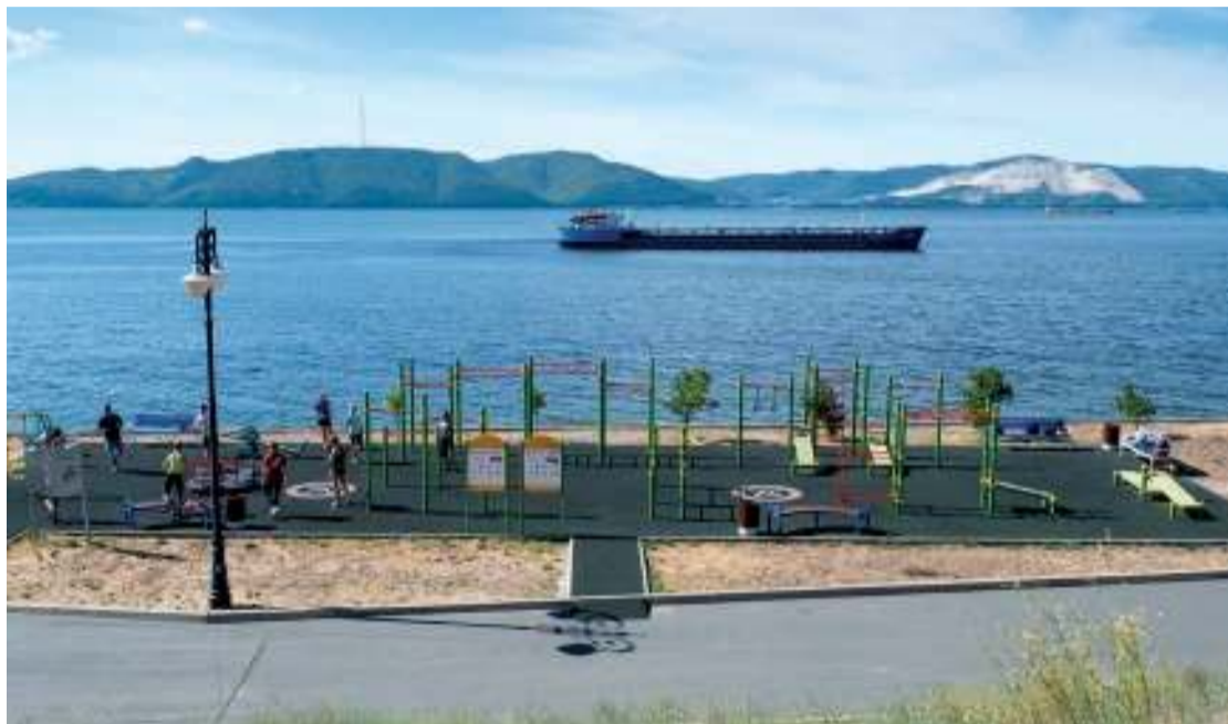
ТОАЗ поддерживает спорт, здоровые привычки и активный стиль жизни

Химики оказались в группе №2 вместе с железнодорожниками, авиаторами, сотрудниками промышленных предприятий и служб жизнеобеспечения. Работники Тольяттиазота уже не первый год выступают основой и лидерами химической сборной, они бежали на лыжах и в кроссе, играли в футбол, баскетбол, настольный теннис и поднимали гири. Отдадим должное и коллегам. Например, КуйбышевАзот отправлял своих спортсменов на